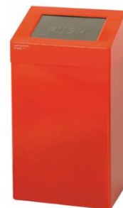
PP0020RAL / PP0050RAL acabado RAL