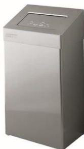
PP0020CS / PP0050CS acabado satinado