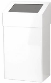
PP0020 / PP0050 acabado epoxi blanco